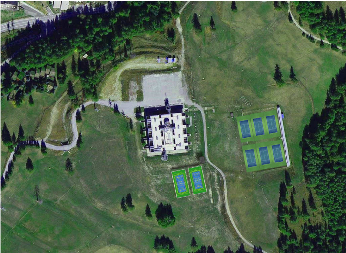
VISTA AEREA INSERIMENTO PROGETTO