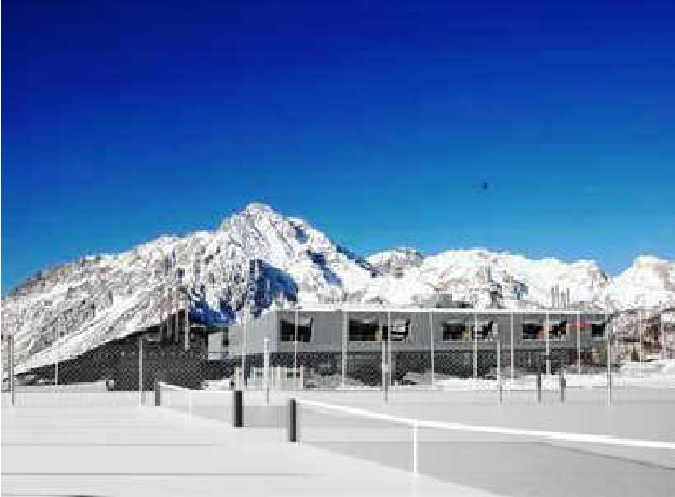
VISTA OVEST INSERIMENTO PROGETTO