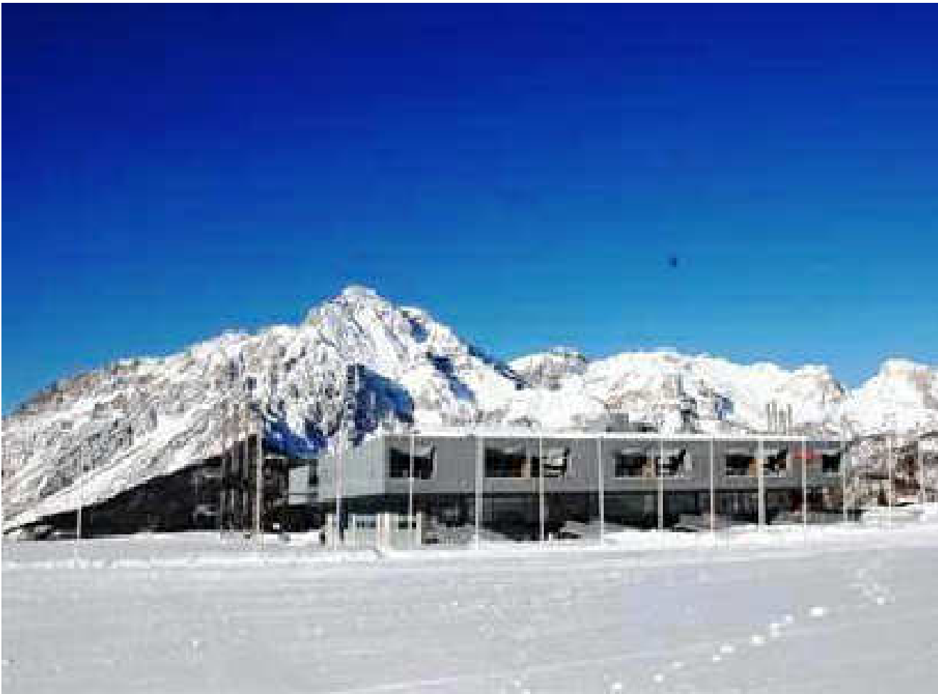
VISTA OVEST STATO DI FATTO