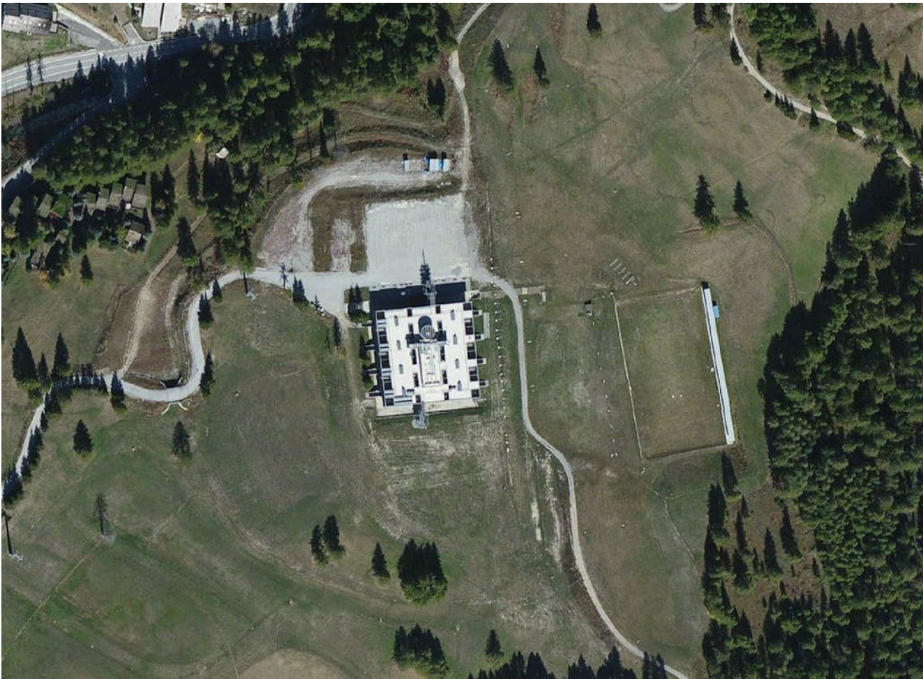
VISTA AEREA STATO DI FATTO